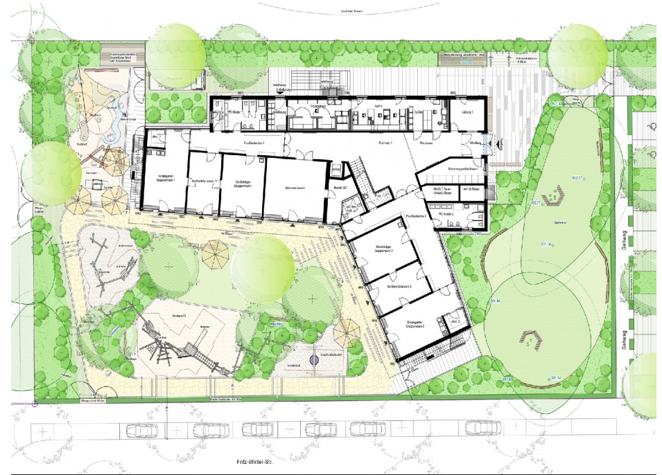
Grundriss Erdgeschoss Fotografie Boschmann + Feth Architekten